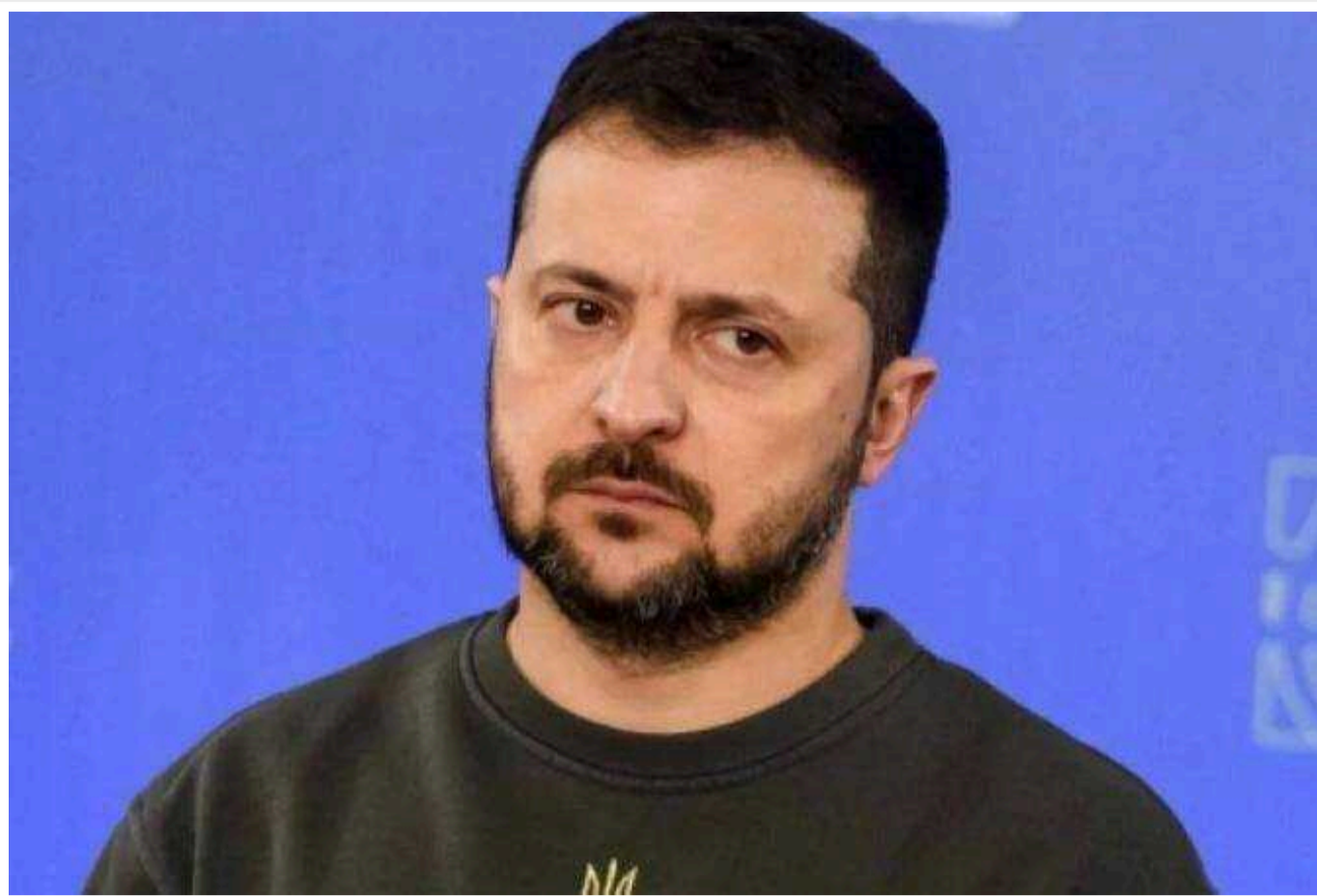
Президент Зеленський розповів про свої "не дуже цікаві спогади" про спілкування з Путіним і про те, як той не захотів відпустити із ув'язнення батька хлопчика з Криму

"Я можу приблизно розповісти, я вже не дуже добре пам'ятаю - це одна з наших останніх телефонних розмов", - сказав Зеленський.