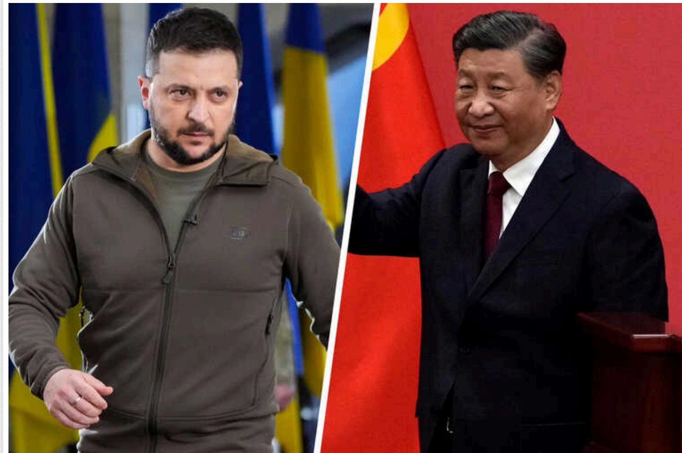
Ермак відверто про розмову Зеленського та Сі Цзіньпіна: "Я був вражений"