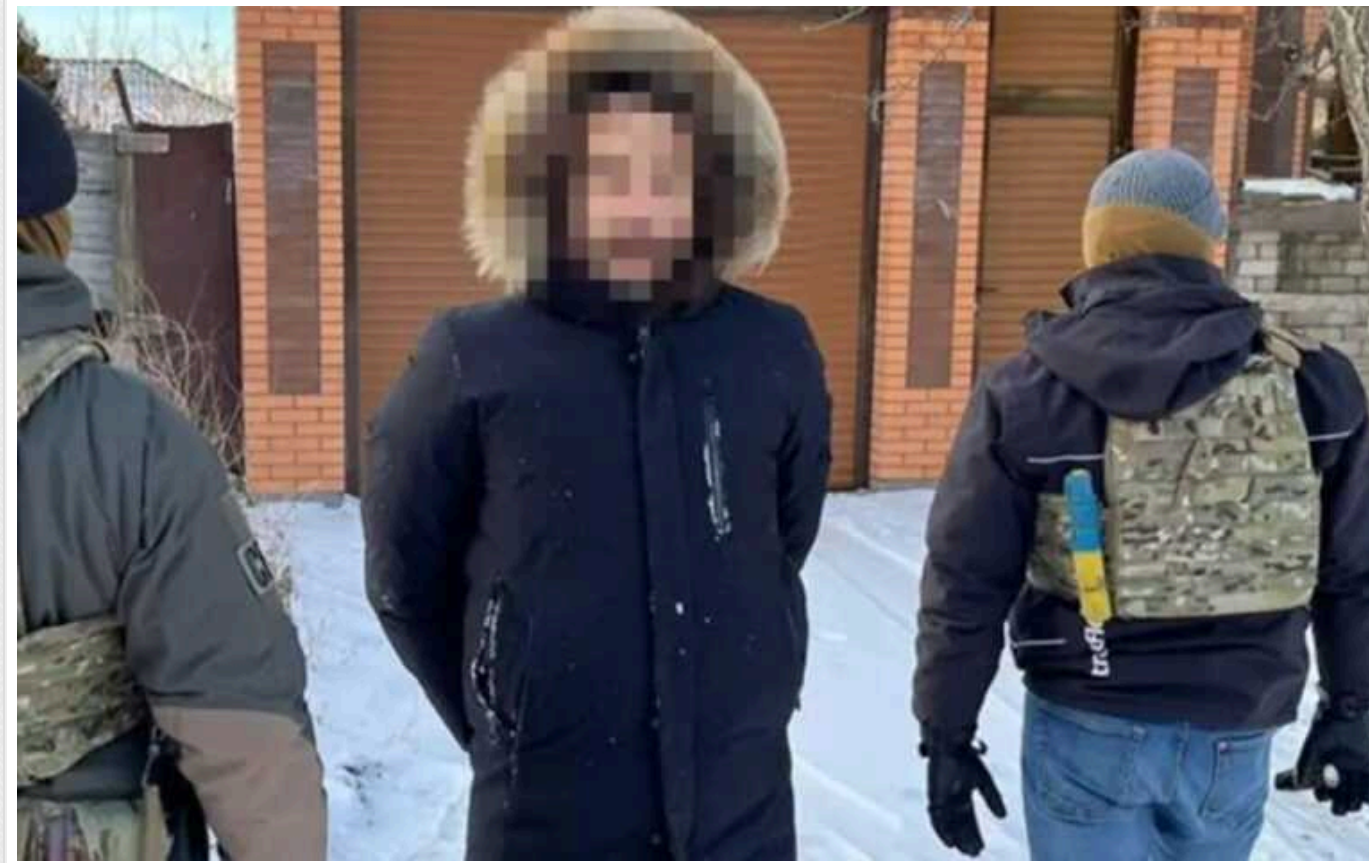
СБУ затримала тітокера з Одеси, що виправдовував ворожі обстріли Харкова

Він казав, що РФ б'є тільки по військовим.