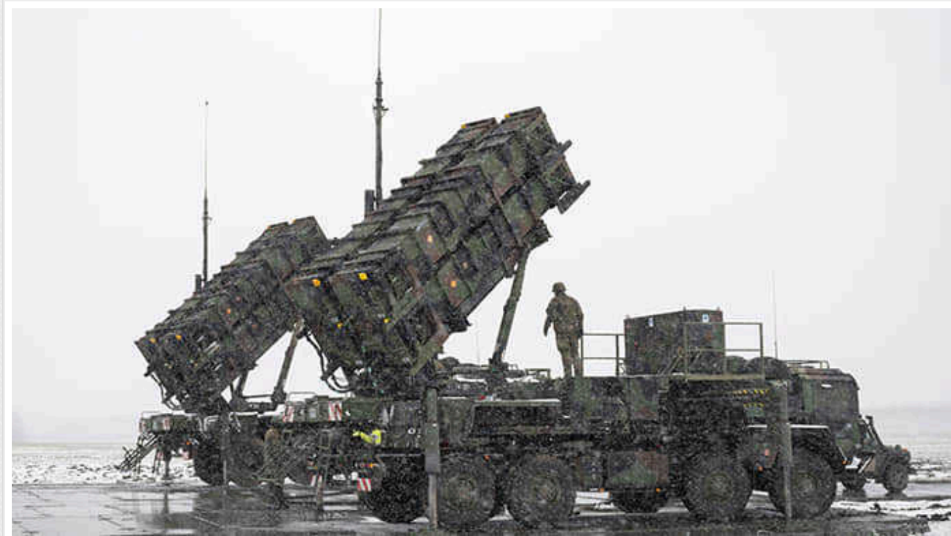
Російські "Кинджали" програють бій із Patriot, що розчаровує Китай,- Newsweek

Китайські експерти в галузі оборони були не надто вражені характеристиками російських гіперзвукових ракет "Кинджал", особливо коли йшлося про їхню живучість проти систем ППО Patriot, які використовує Україна. Зазначається, що таку саму зенітно-ракетну систему американського виробництва розгорнуто в Тайвані, армія якого має понад дюжину батарей на додаток до систем ППО вітчизняного виробництва.