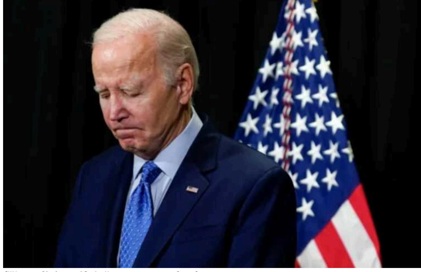
США могли б "задушити" Росію. Чому вони цього не роблять?

Америка здатна створити у Росії повноцінну економічну кризу, проте не бачить у цьому необхідності, вважає професор Каліфорнійського університету в Лос-Анджелесі Олег Цихої.