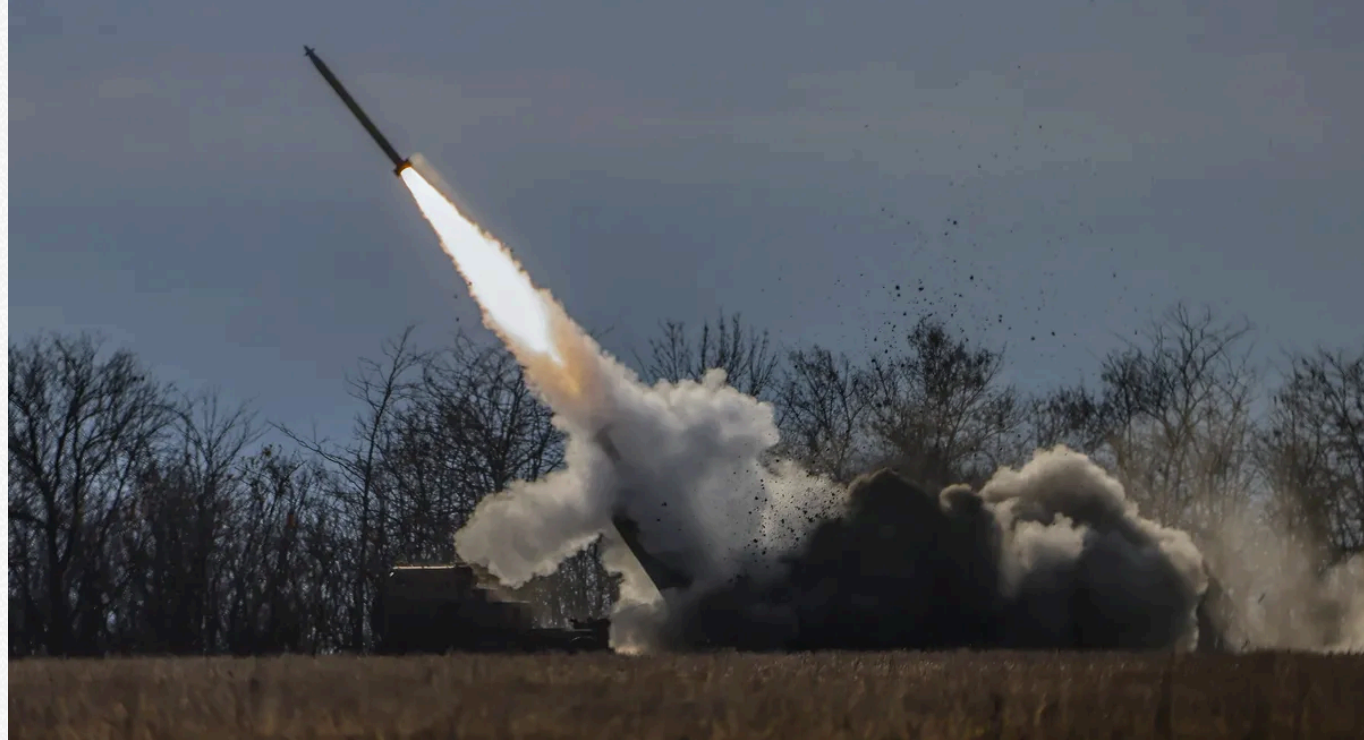
HIMARS стали серйозною проблемою для російської армії.

Також США можуть легко вирішити проблему нестачі снарядів для постачання України. За даними дослідницької групи Кільського інституту, з початку вторгнення Росії в Україну США та їхні союзники відправили їй безприпасів, ракет і танків на суму близько 100 млрд доларів. Однак цього замало.