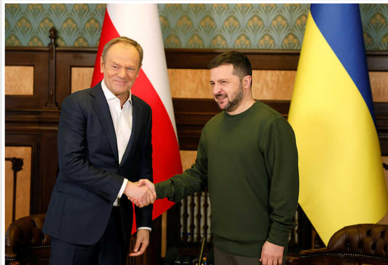
Прем'єр Польщі Туск призначить уповноваженого з відновлення України

Прем'єр-міністр Польщі Дональд Туск, під час візиту до Києва, повідомив про призначення уповноваженим уряду Польщі з питань відновлення України.