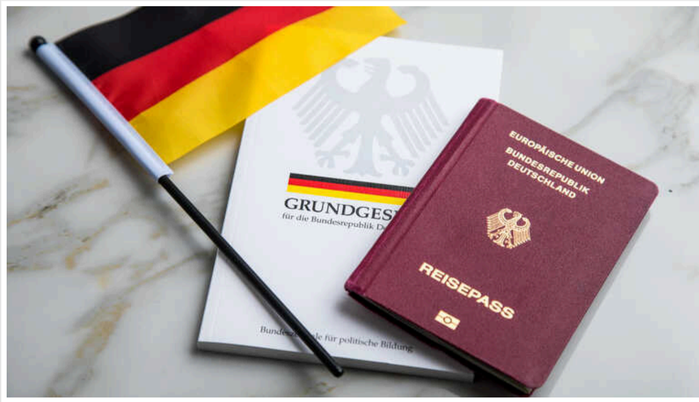
У Німеччині ведеться обговорення щодо можливості прийняття на службу до армії осіб без громадянства цієї країни, – Deutsche Welle

Про це повідомив міністр оборони Пісторіус.