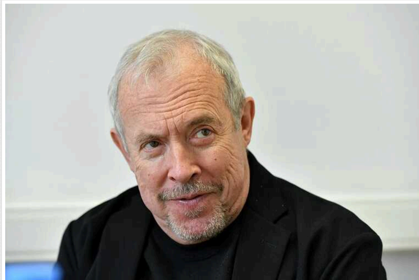
Андрій Макаревич послав російських пропагандистів: поширюють про нього фейки через підтримку України

Російський музикант, лідер гурту "Машина времени" Андрій Макаревич, що відкрито підтримує Україну у війні з Росією та засуджує путінський режим, послав пропагандистів, які поширюють про нього фейки. До кремлівських "писак" артист звернувся з проханням відвалити від нього.