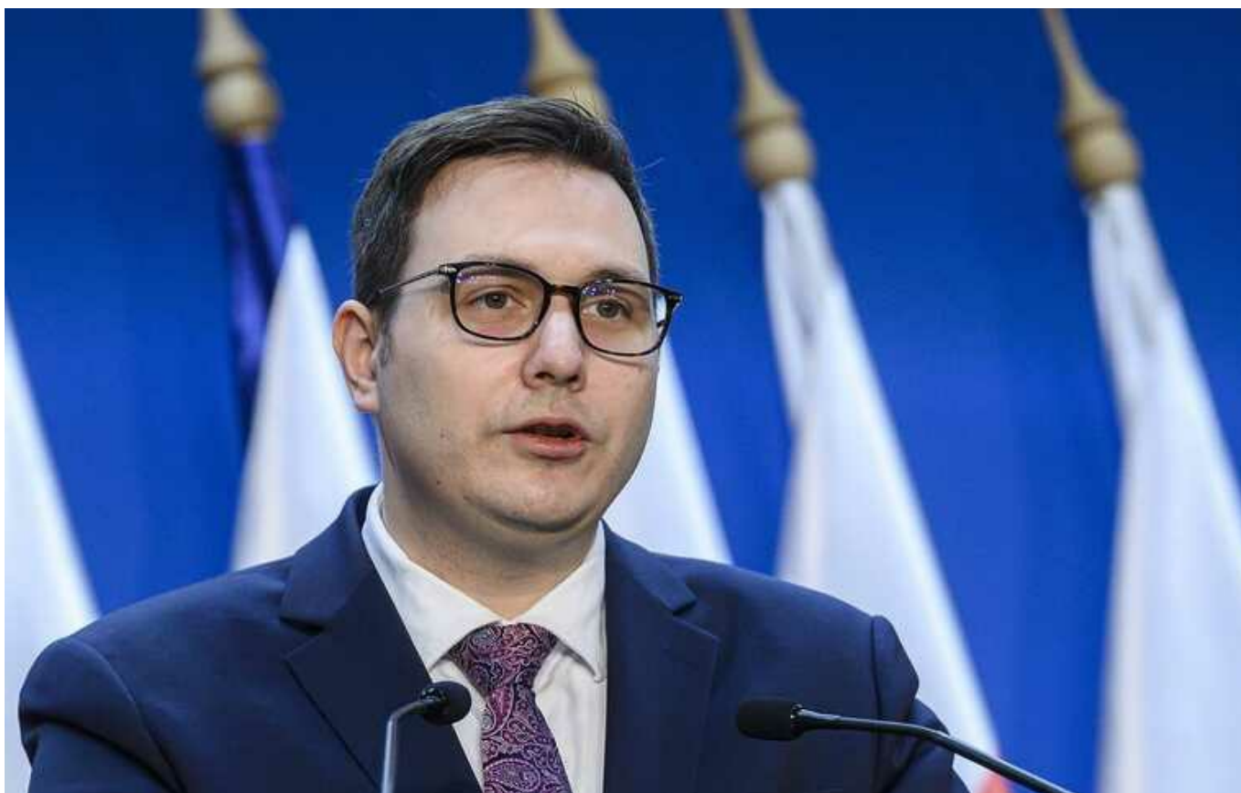
Ліпавський: Чехія не висилатиме українців призовного віку

Чехія не висилатиме українців призовного віку на батьківщину для служби у ЗСУ. Таку