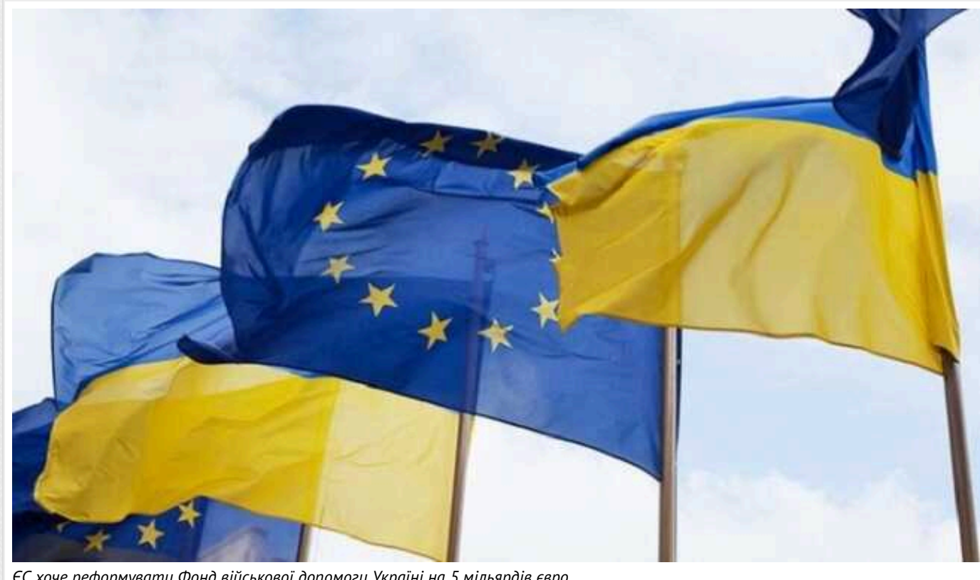
ЄС хоче реформувати Фонд військової допомоги Україні на 5 мільярдів євро

Зовнішньополітичне відомство Євросоюзу представило пропозицію щодо реформування фонду, який надає військову підтримку Україні, оскільки ЄС переходить від надання зброї з наявних запасів до закупівлі нової.