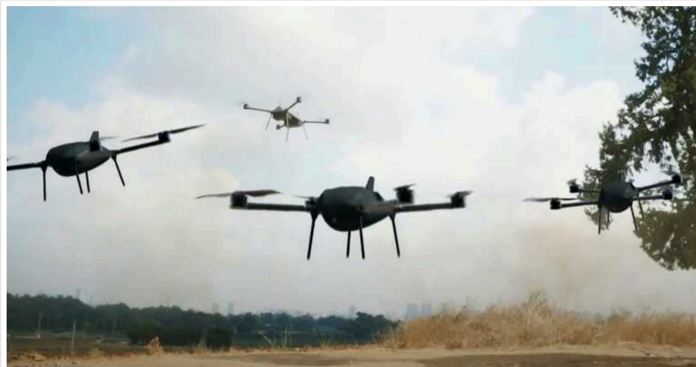
Israel Aerospace Industries представила новий протитанковий дрон-камікадзе Rotem Alpha: здатний пробити понад 600 мм балістичної сталі

Ізраїльська компанія Israel Aerospace Industries представила новий протитанковий дрон-камікадзе Rotem Alpha квадрокоптерного типу. Дрон має велику витривалість як у повітрі, так і в режимі очікування.