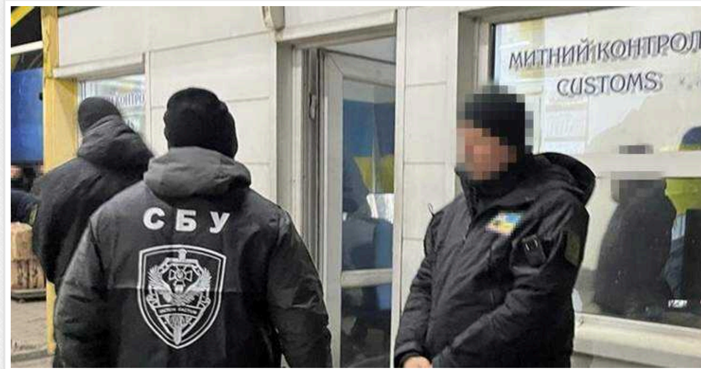
СБУ викрила митників у Чопі: вимагали хабарі у міжнародних перевізників

Митники пункту пропуску «Чоп» за зміну пропускали через схему 50 автобусів, беручи з кожного по 1500 євро.