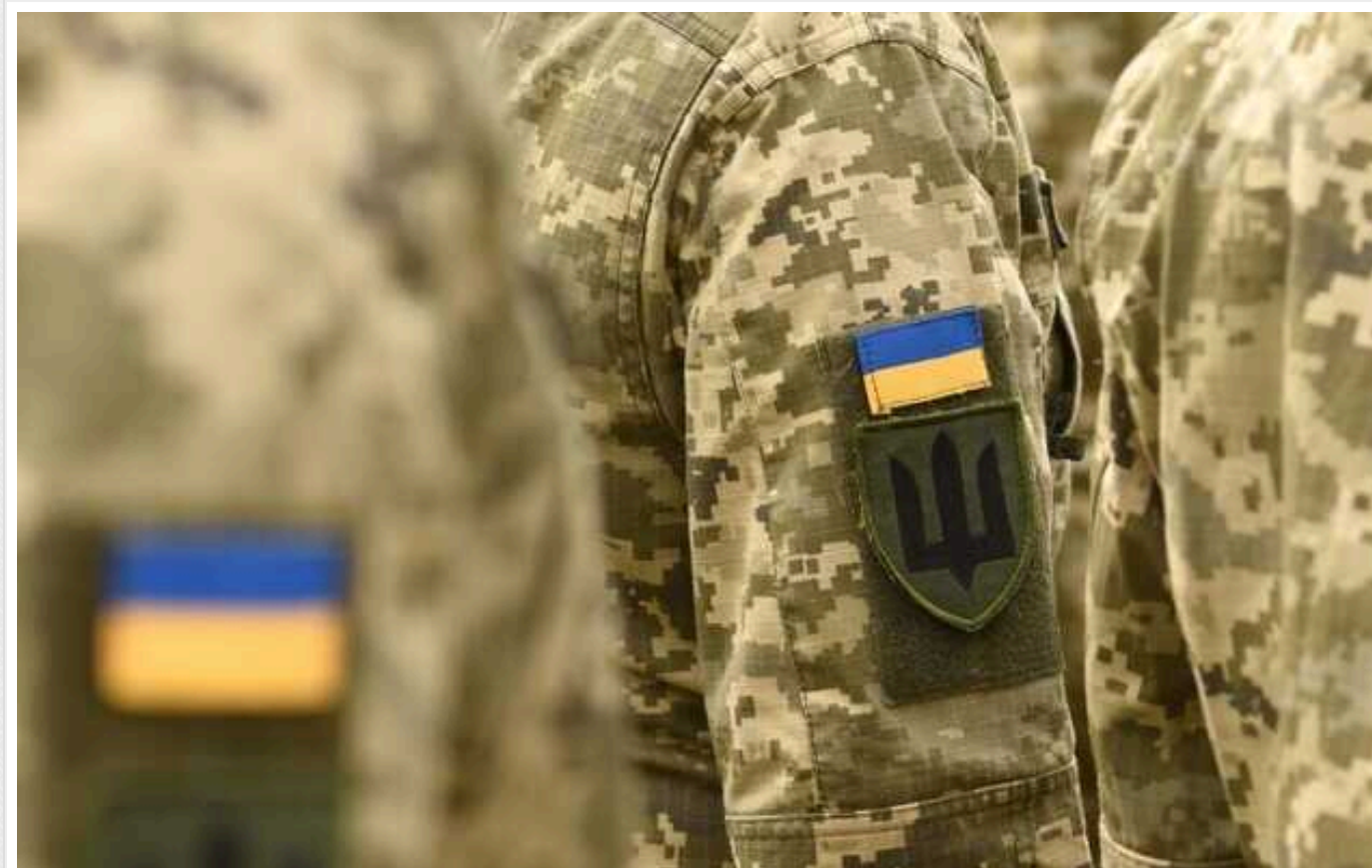
Полковника ЗСУ та бізнесмена викрили у махінаціях з оборонкою

Правоохоронці викрили ще одну схему розкрадання державних коштів на оборонних замовленнях для Сил безпеки та оборони України.