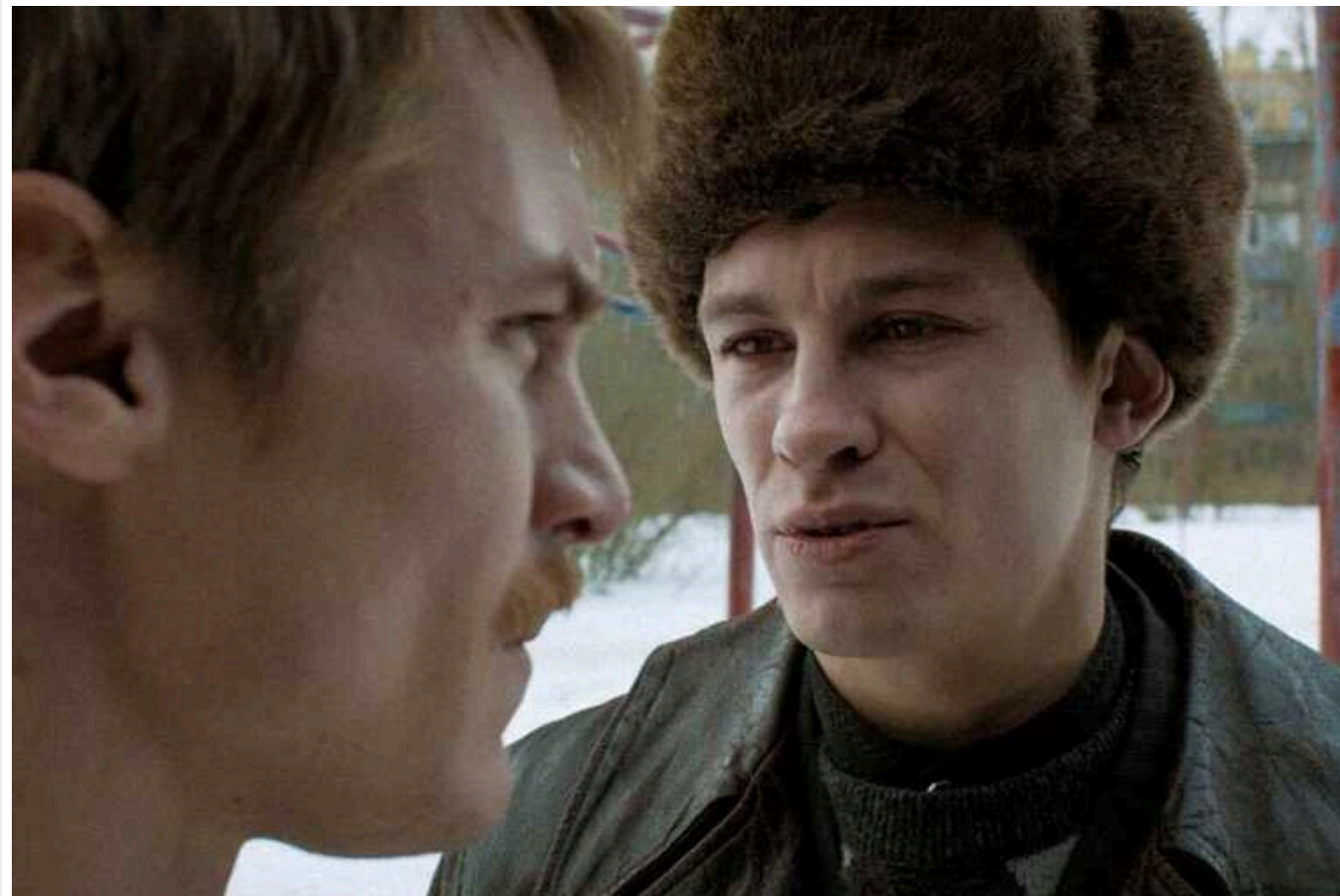
Чому не треба дивитися "Слово пацана": актор скандального серіалу публічно підтримав російських окупантів