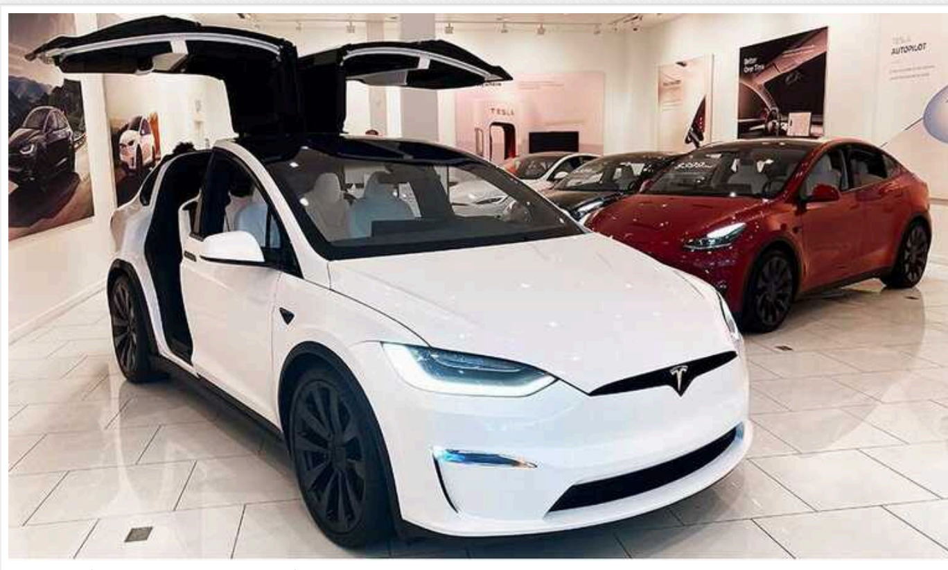
В Україні збільшився попит на автомобілі Tesla

В Україні спостерігається бум на автомобілі Tesla. Зростання, порівняно з довоєнним рівнем, – приблизно вдесятеро.