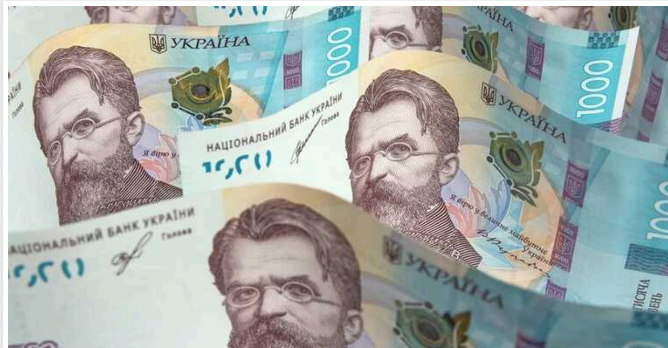
Без допомоги Заходу, Україні доведеться друкувати гроші: може призвести до економічного колапсу, — WSJ

Україні доведеться друкувати гроші без допомоги Заходу, що може призвести до економічного колапсу, — пише WSJ.