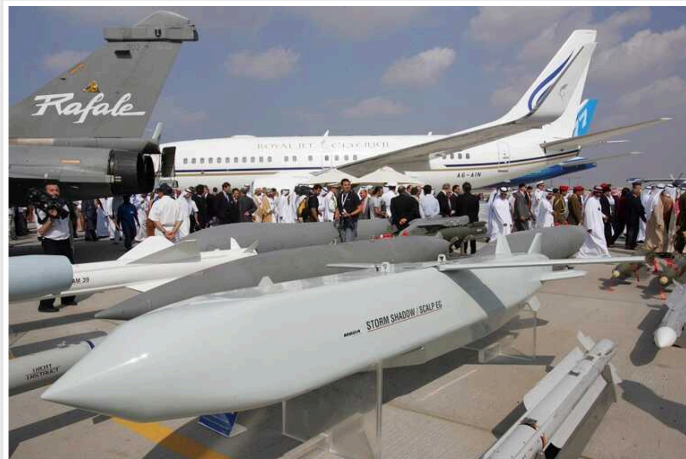
ЗС РФ зізналися, що ракети Storm Shadow занадто складні цілі для російської ППО

Окупанти відзначили чудові характеристики ракети в плані малопомітності – вона з'являється на радарх лише за кілька секунд до ураження цілі.