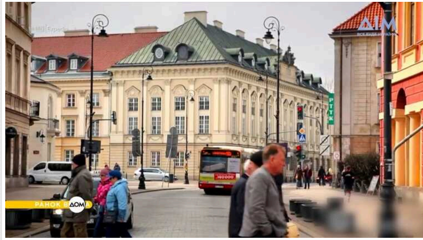
У Польщі поблизу українського кордону виявили залізний скарб римської доби