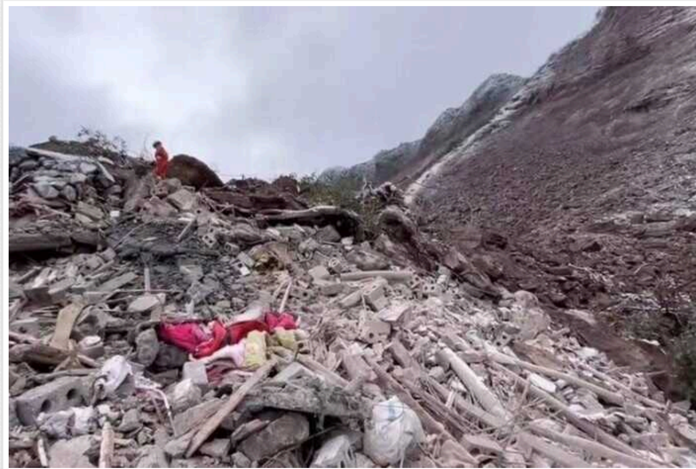
У Китаї стався масштабний зсув ґрунту: під завалами майже півсотні людей

На південному заході Китаю в провінції Юньнань стався масштабний зсув ґрунту, внаслідок чого 47 людей опинились під завалами.