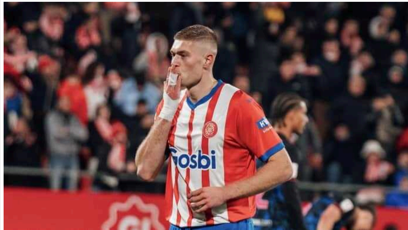
Українець Довбик оформив історичний хет-трик за "Жирону" у матчі Ла Ліги

Голи українця принесли команді розгромну перемогу.