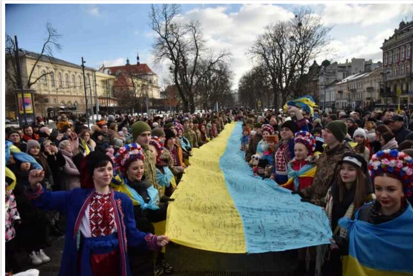
До Дня Соборності у Львові розгорнули рекордний прапор України з підписами воїнів

У Львові, на площі біля Національного академічного театру опери та балету імені Соломії Крушельницької, вчора, 21 січня, розгорнули найбільший Державний Прапор України. На ньому були побажання від військових та дітей, які збирали по всій Україні та лінії фронту.