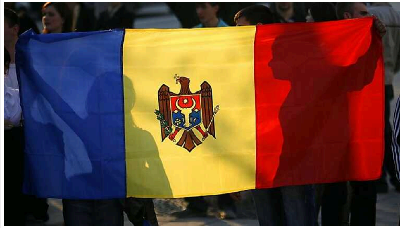
ISW: РФ готує інформаційний ґрунт для дестабілізації ситуації в Молдові

Російська Федерація намагається використати невизнане Придністров'я з метою дестабілізації ситуації в Молдові та готує інформаційний ґрунт для виправдання російської ескалації в регіоні.