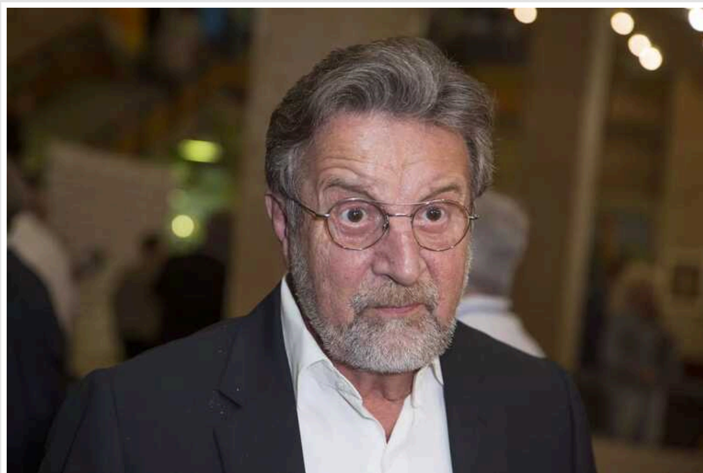
Ярмольник зробив заяву про війну РФ з Україною

Російський актор Леонід Ярмольник, якому виповнюється 70 років, вперше публічно підтримав війну з Україною.