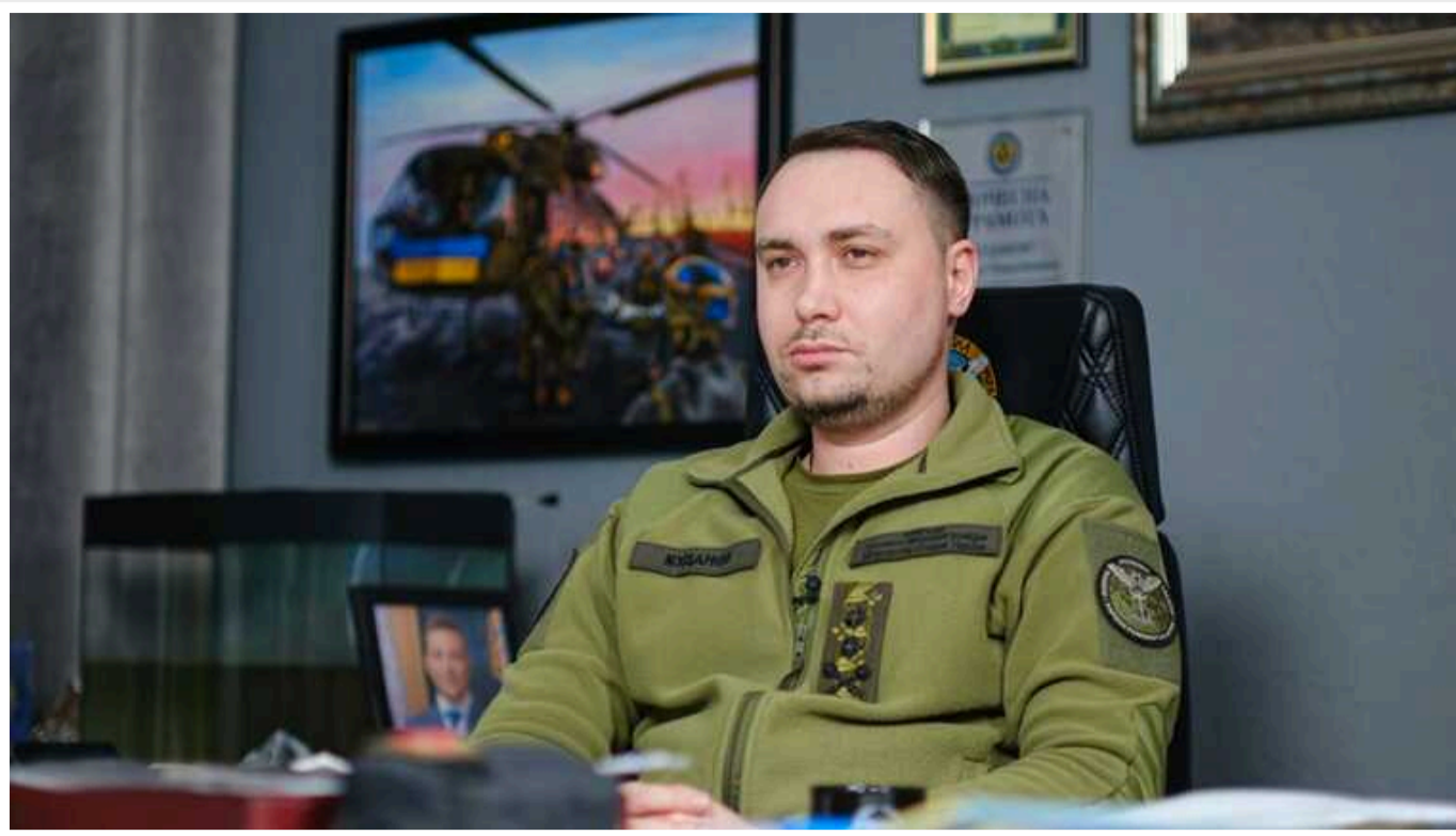
Говорити, що сталася катастрофа, неправда, - Буданов про контрнаступ ЗСУ

Говорити, що все добре в контрнаступі Збройних сил України, неправда. Як і говорити, що сталася катастрофа.