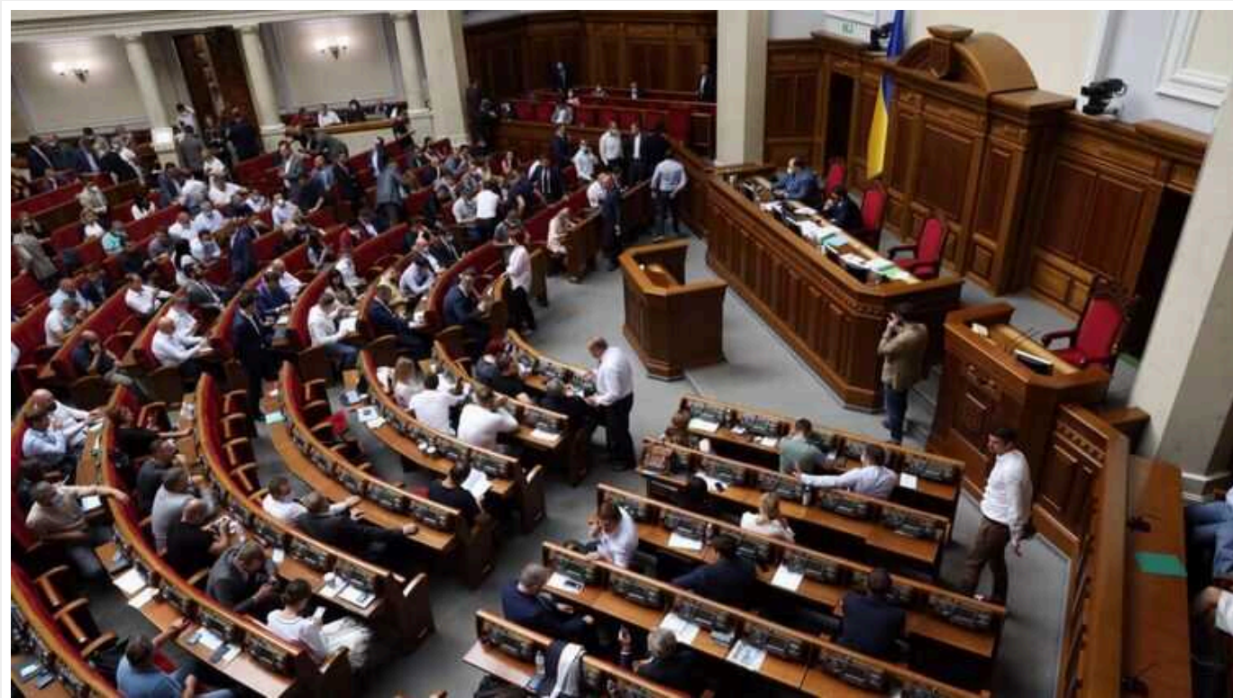
Депутатам Верховної ради підвищили зарплати

Після підвищення прожиткового мінімуму з 1 січня 2024 року збільшились і зарплати депутатів Верховної Ради України.