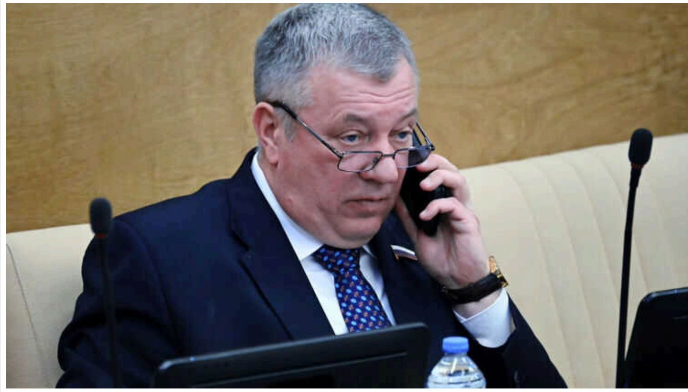
У Держдумі РФ запропонували відродити ГУЛАГ для незгодних із політикою Путіна росіян