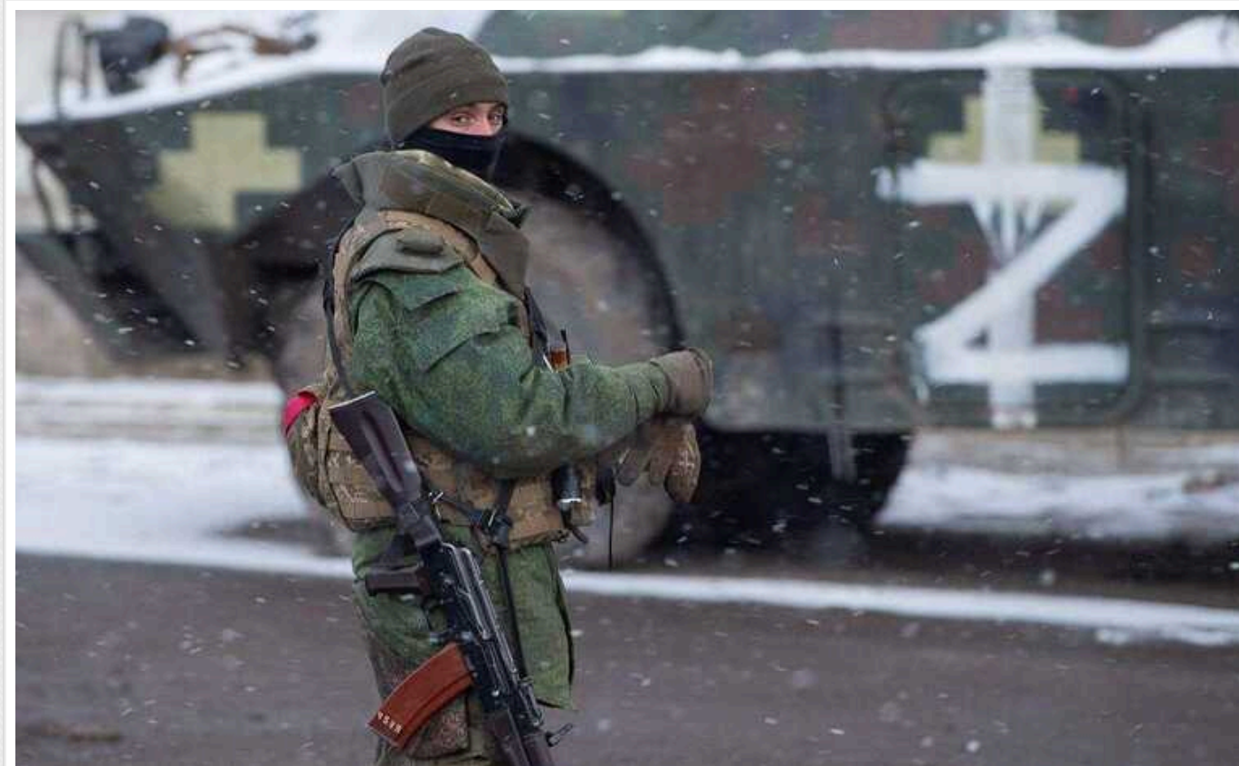
Окупанти в Кринках записали жалісливе звернення до Шойгу та поскаржилися на натиск ЗСУ: "Не було жодного вихідного"

Російські військовослужбовці, яким наказали штурмувати село Кринки, що розташоване на лівому березі Дніпра, на Херсонщині, незадоволені сильним тиском ЗСУ, умовами, в яких їм доводиться воювати та матеріальним забезпеченням. На все це вони поскаржилися міністру оборони РФ Сергію Шойгу у відповідному відеозверненні.