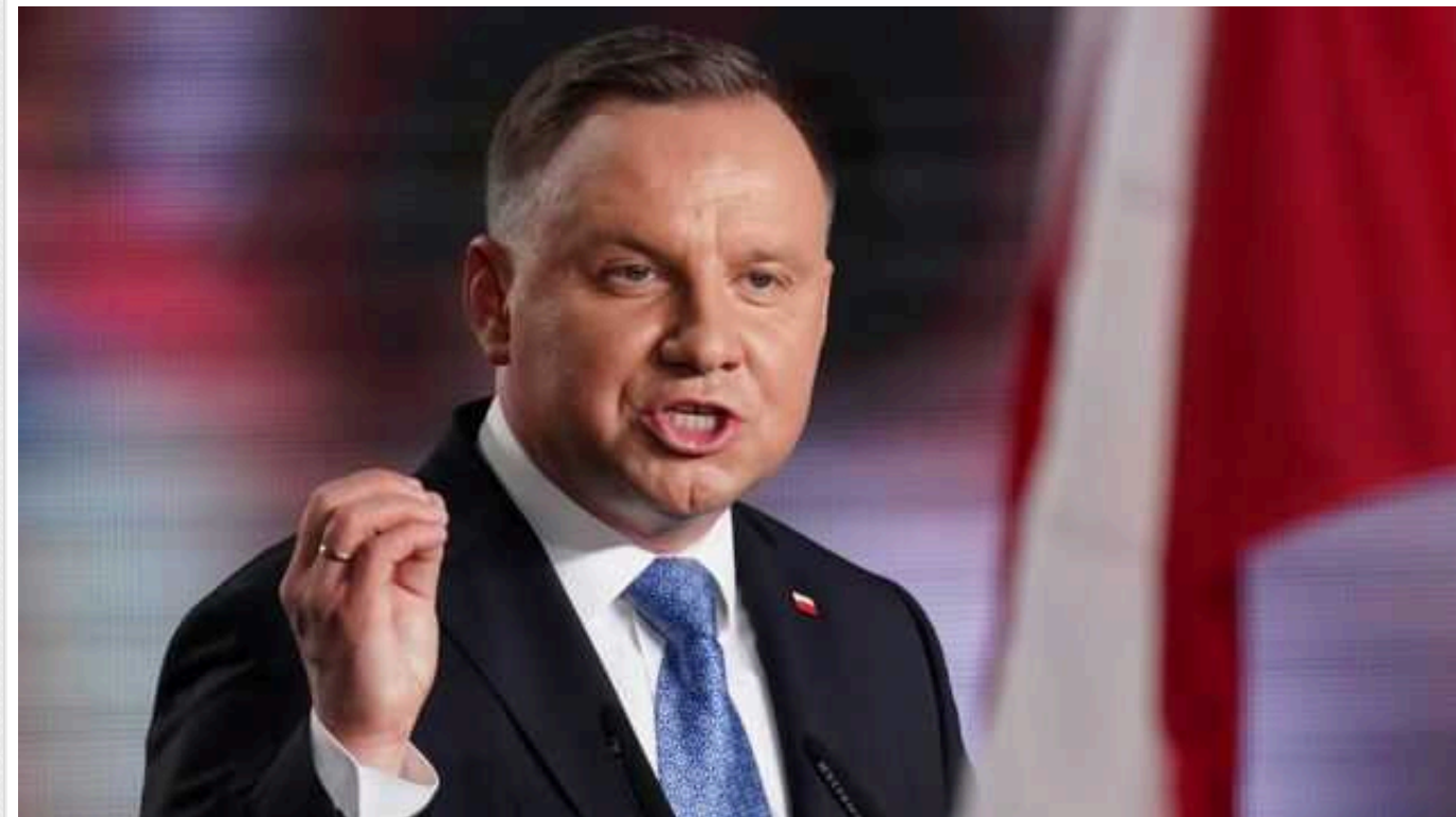
Польський президент наполіг, що Польща має підтримувати Україну у війні

Президент Польщі Анджей Дуда вважає, що допомогу Україні варто не лише продовжувати, а й посилювати. Без передачі Києву озброєння армії держави буде складно стримувати російських окупантів та звільняти захоплені ними території.