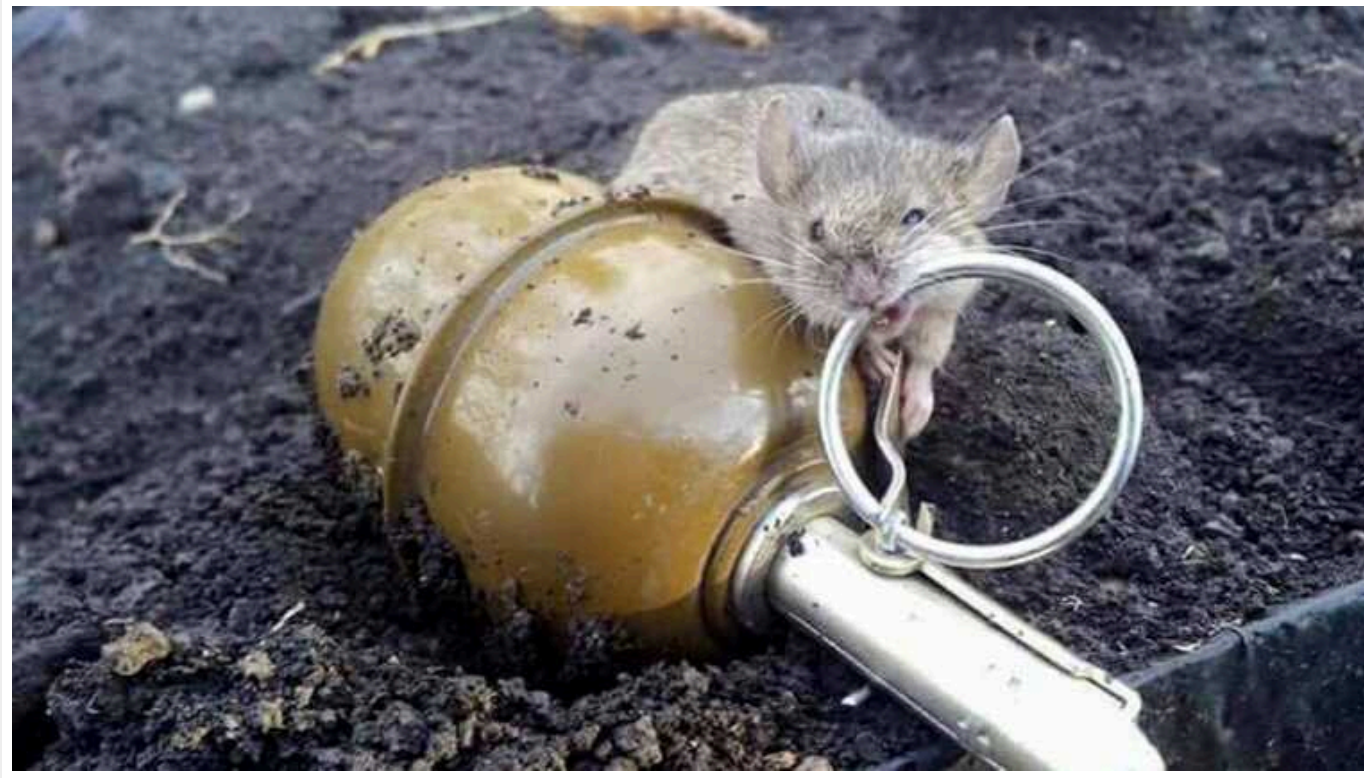
Гризуни заповнили окопи в Україні. Це похмуре відлуння Першої світової війни

Пацюки та миші розповсюджують хвороби, що викликають у солдат блювоту та кровотечу з очей, підривають боєздатність та відтворюють моторошні умови часів Першої світової війни;