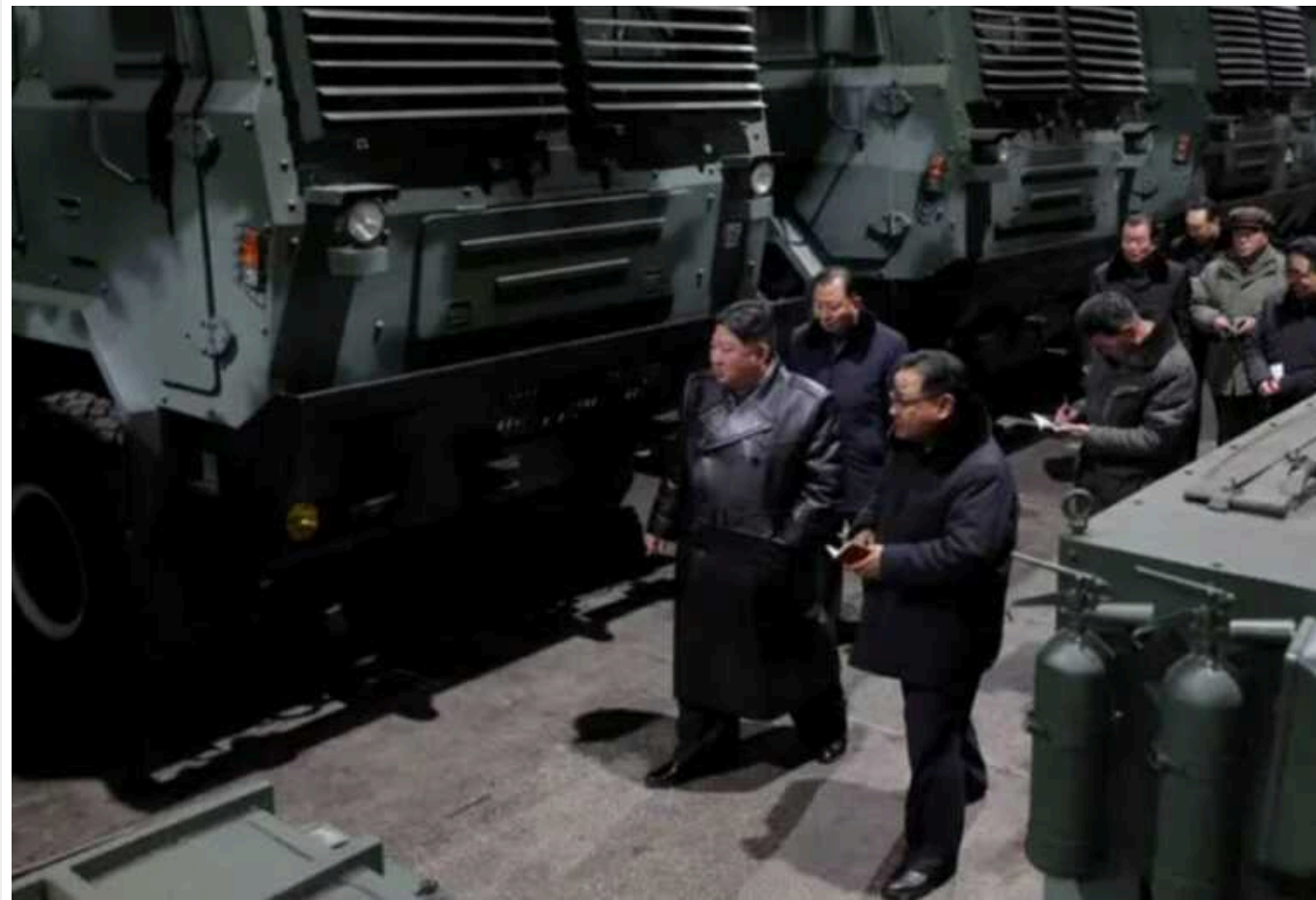
Чи справді Кім Чен Ин планує напад цього разу? – аналітика The New York Times

Північна Корея випустила сотні артилерійських снарядів водами поблизу південнокорейських прикордонних островів 5 січня. Минулого тижня вона заявила, що більше не розглядає Південну Корею як "співвітчизників", а як "ворожу державу", яку вона підпорядкує собі за допомогою ядерної війни.