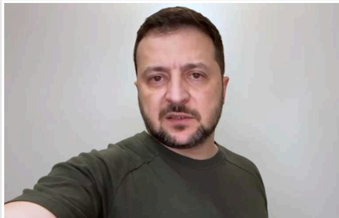
Зеленський: Ми вже визначили пріоритети на наступні тижні, чітко бачимо завдання

Представники України вже визначили пріоритети на наступні тижні щодо пакетів допомоги від партнерів, по політичній взаємодії та по кроках для фінансової стійкості держави.