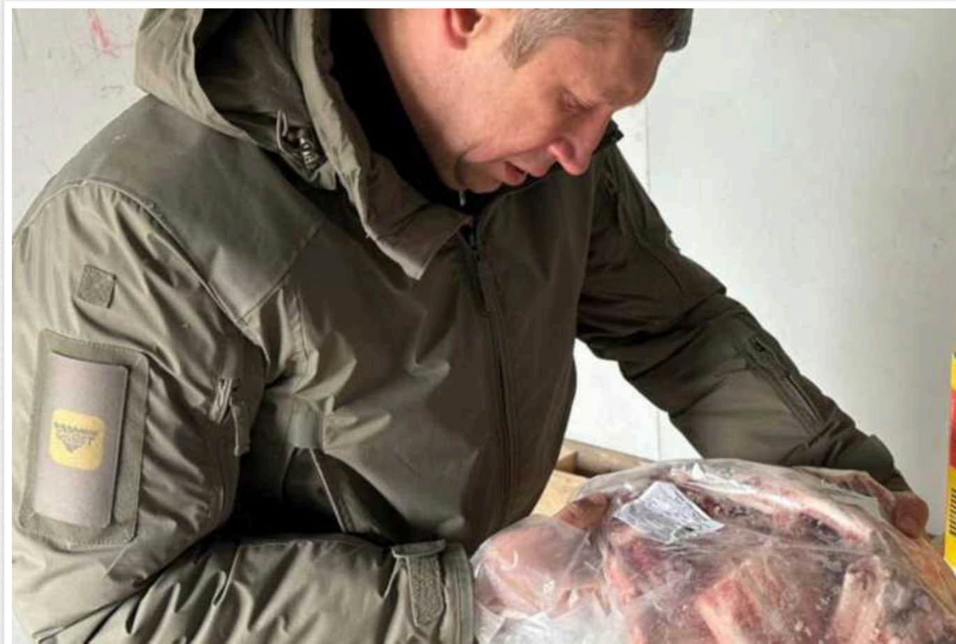
Міноборони під час перевірок знайшло порушення в одного з найбільших постачальників харчів для ЗСУ

Один з найбільших підрядників Міноборони зриває строки постачання харчів для військовослужбовців та передає у війська неякісні продукти.