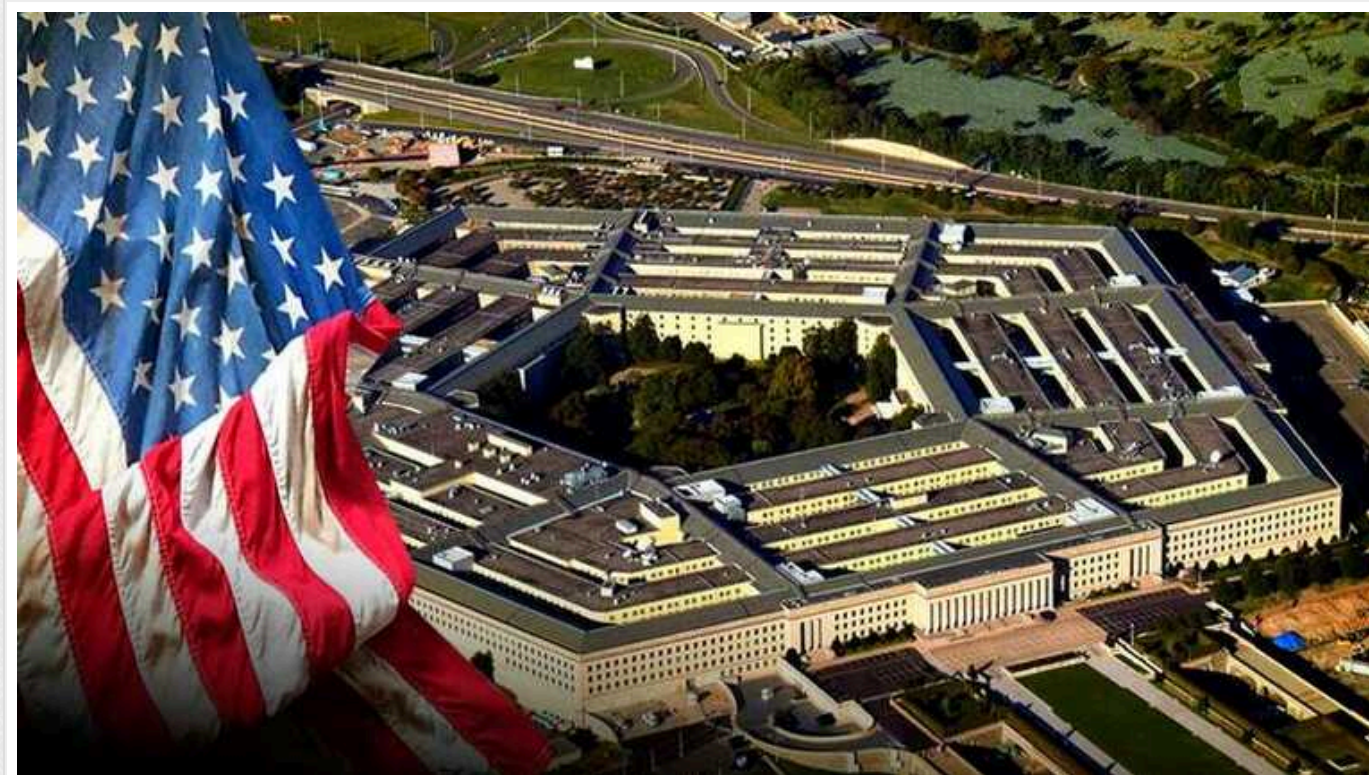
Сполучені Штати готуються до тривалої військової кампанії проти хуситів

Адміністрація президента США Джо Байдена розробляє плани тривалої військової кампанії проти єменських хуситів після того, як низка завданих ударів не змогла зупинити напади угруповання на іноземні судна в Червоному морі.