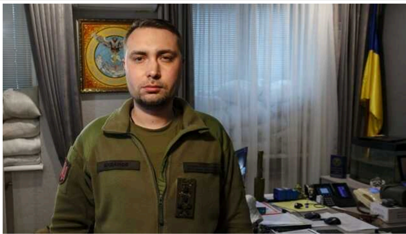
Україна довела, що «могутність» РФ є мильною бульбашкою - Буданов

Україна вже довела, що легенда про «могутність» Росії - це мильна бульбашка.