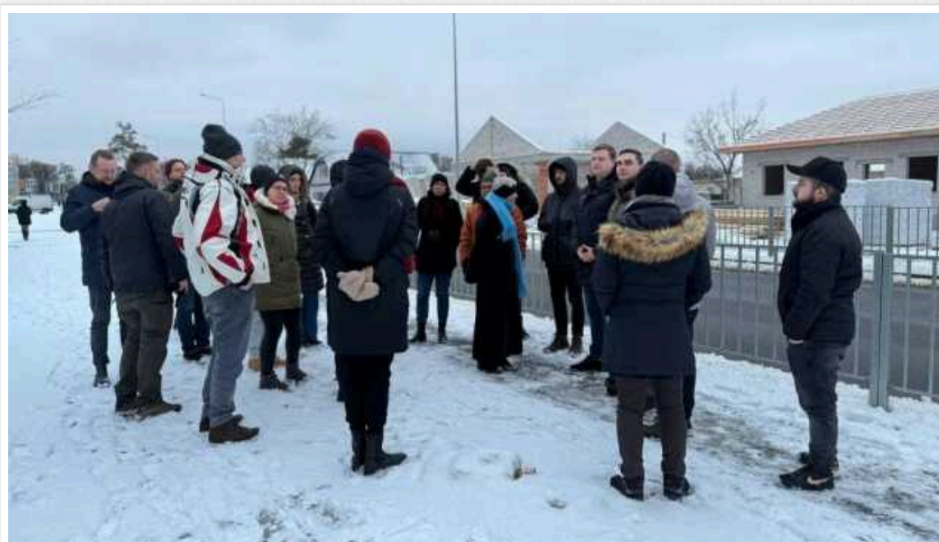
Ірпінь відвідала делегація Бундестагу

Делегація німецького парламенту - Бундестагу - відвідала Ірпінь Київської області.