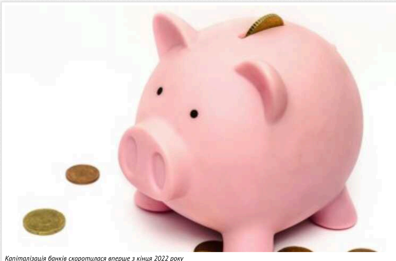
Капіталізація банків скоротилася вперше з кінця 2022 року

Показник достатності регулятивного капіталу банків зменшився уперше з кінця 2022 року.