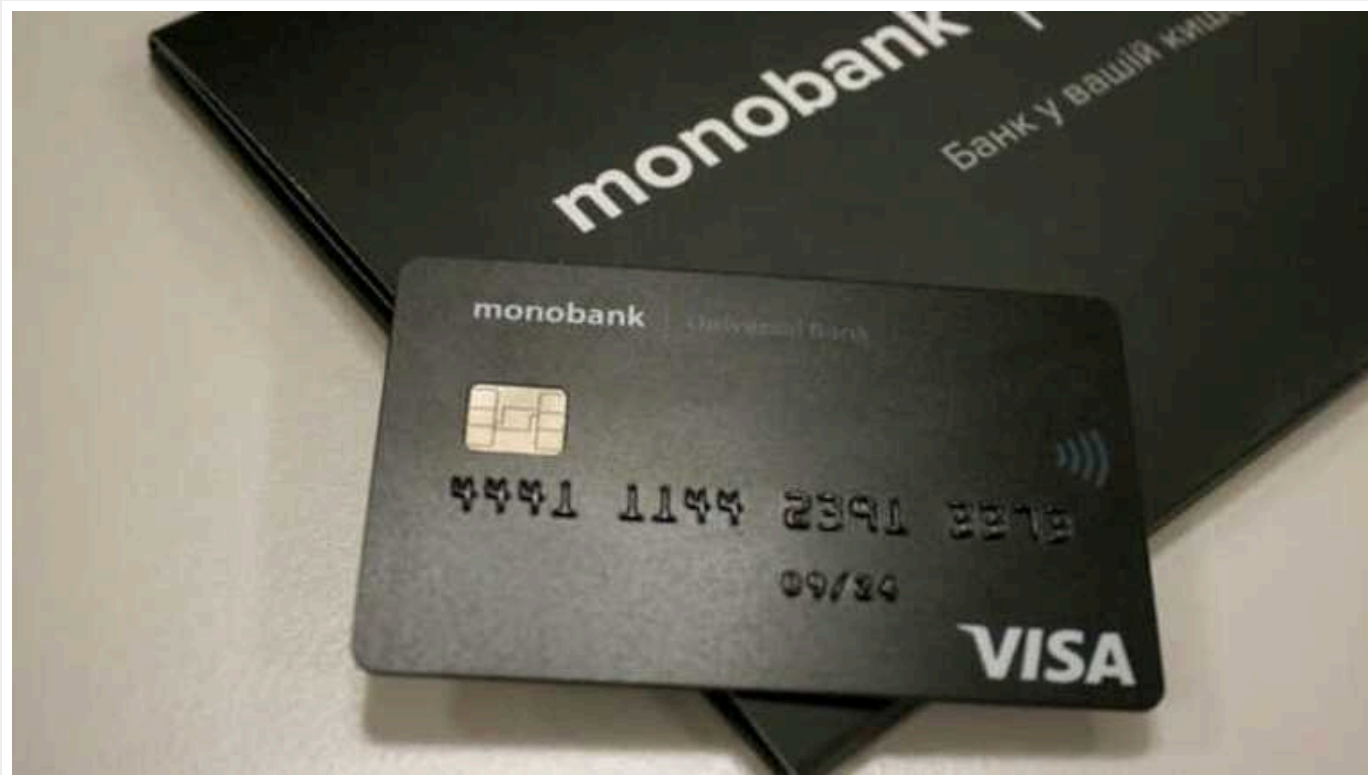
Монобанк втратив 112 мільйонів доларів від початку війни

Фінансові збитки Монобанк з початку повномасштабного вторгнення Росії в Україну становлять 4,25 млрд грн, або $112 млн.