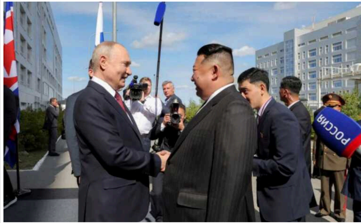
Путін відвідає КНДР найближчим часом, - ЦТАК

Востаннє російський президент наносив візит до Пхеньяну понад два десятиліття тому - у 2000 році. Його там зустрічав попередній голова КНДР Кім Чен Ир.