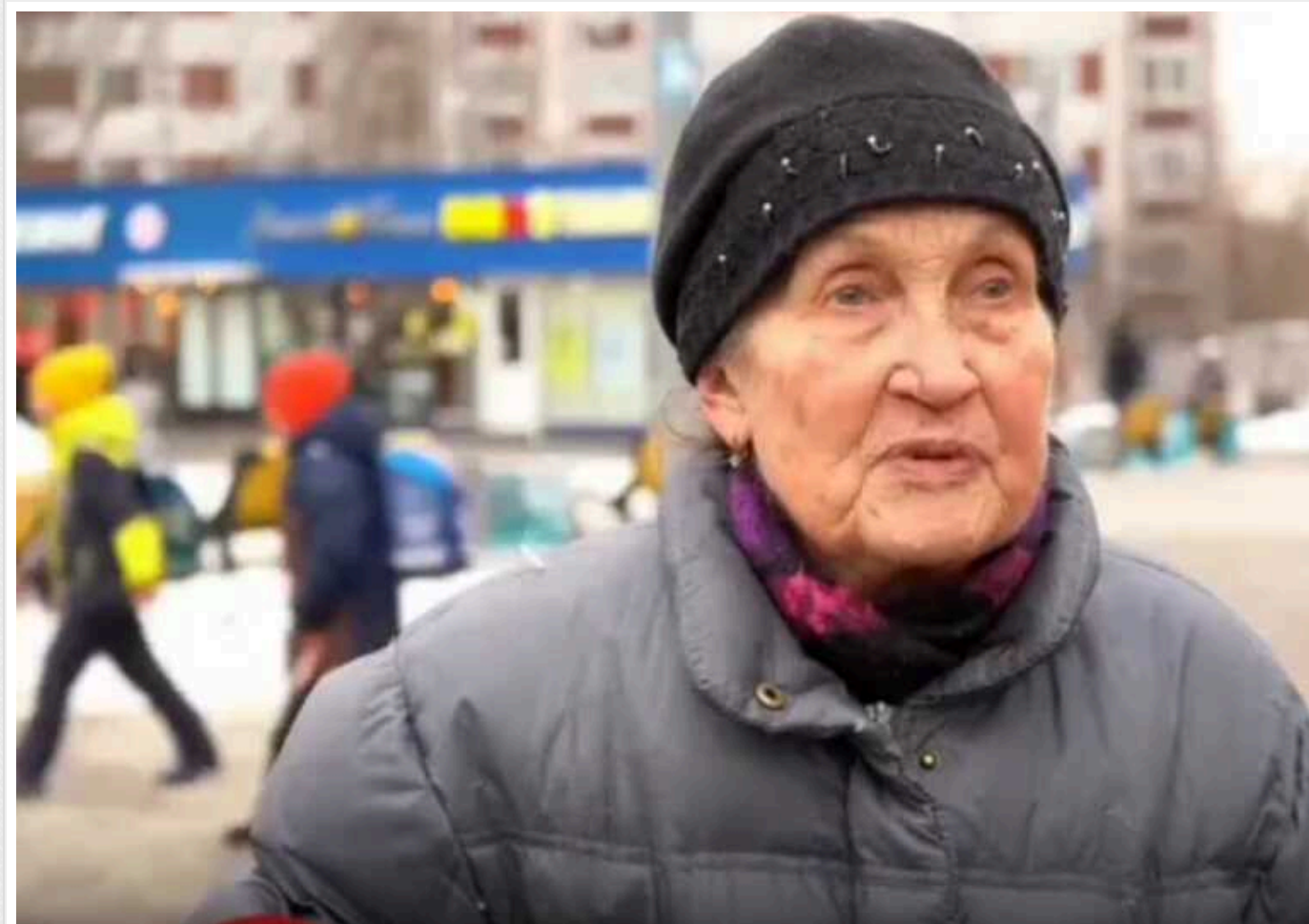
82-річна росіянка присоромила російську молодь за страх перед Путіним: "Ви всього боїтеся"

82-річна громадянка Росії послала "за російським кораблем" кремлівського диктатора Володимира Путіна. Вона також закликала російську молодь припинити боятися.