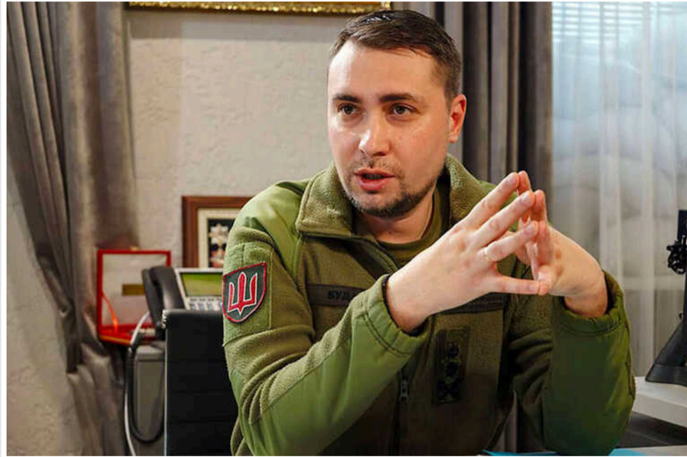
Буданов висловився про смерть Пригожина та долю ПВК "Вагнер": "Не поспішав би з висновками"

В українській военній розвідці не поспішають із висновками щодо смерті ватажка російської приватної компанії "Вагнер" Євгена Пригожина. Він нібито загинув нібито в авіакатастрофі під Твер'ю в серпні 2023 року, але жодних доказів тому немає.