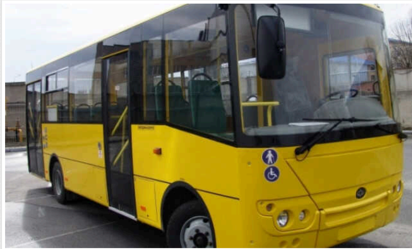
Вишгород заплатить 1,4 мільйона гривень за оренду двох "Богданів"

Комунальне підприємство (КП) Вишгородської міської ради "Вишгородпастранс" має намір орендувати два автобуси "Богдан" для здійснення пасажирських перевезень по місту. Користуватися автобусами в КП планують протягом року, за оренду готові заплатити понад 1,4 млн гривень.