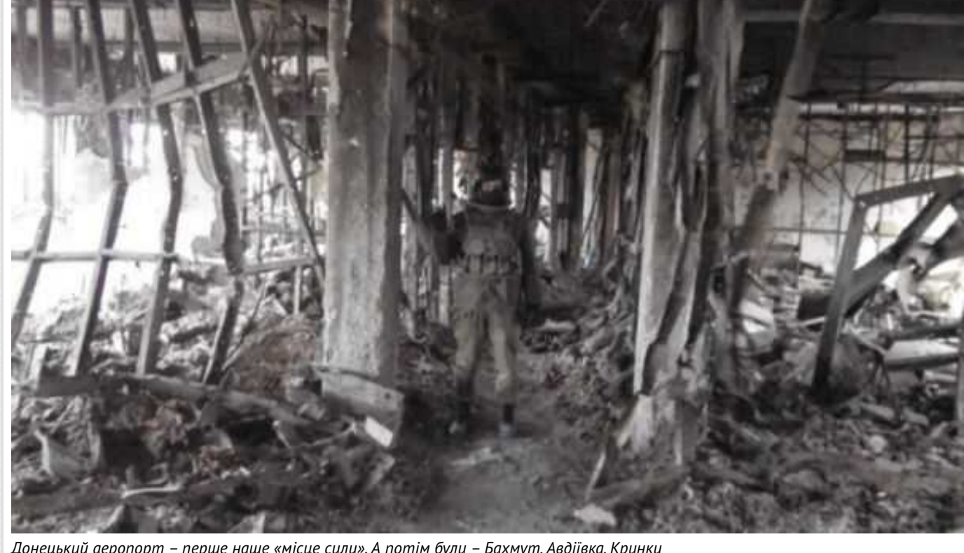
Донецький аеропорт – перше наше «місце сили». А потім були – Бахмут, Авдіївка, Кринки

Якби не ДАП, не Дебальцеве, якби не було Іловайська або Широкинської операції, не було б ЗСУ в тому форматі, в якому постало військо України. ДАП дав нашим військовим безцінний досвід, дав цілу низку бойових офіцерів, які стали командирами першої ланки.