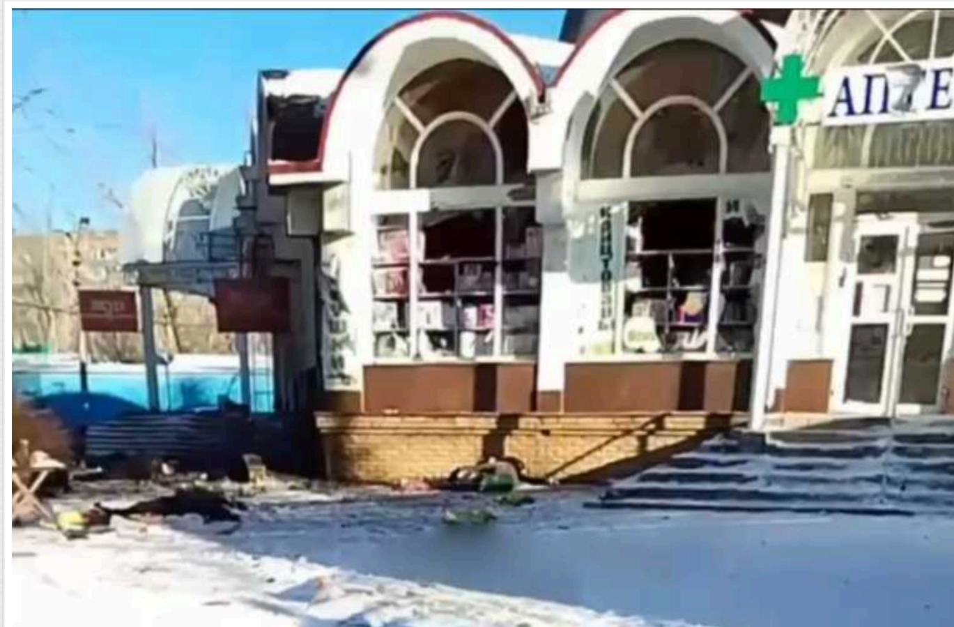
У Донецьку внаслідок ранкового обстрілу ринку в мікрорайоні Текстильник відомо про щонайменше 25 загиблих

Наразі відомо про 25 загиблих та десятки поранених. Як стверджують у мережі, окупанти не поспішають прибрати тіла загиблих із ринку – їх просто накрили тканиною.