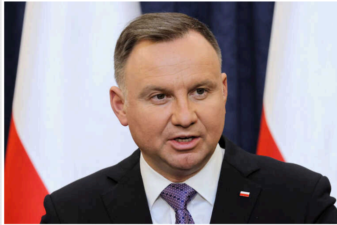
Президент Польщі категорично проти перевірок суддів, призначених під час його президентства

Президент Польщі Анджей Дуда заявив, що відкритий до переговорів з новим урядом щодо змін у судовій системі, але висуває умовою відмову від перевірок суддів, які були призначені за перебування при владі партії "Право і справедливість".