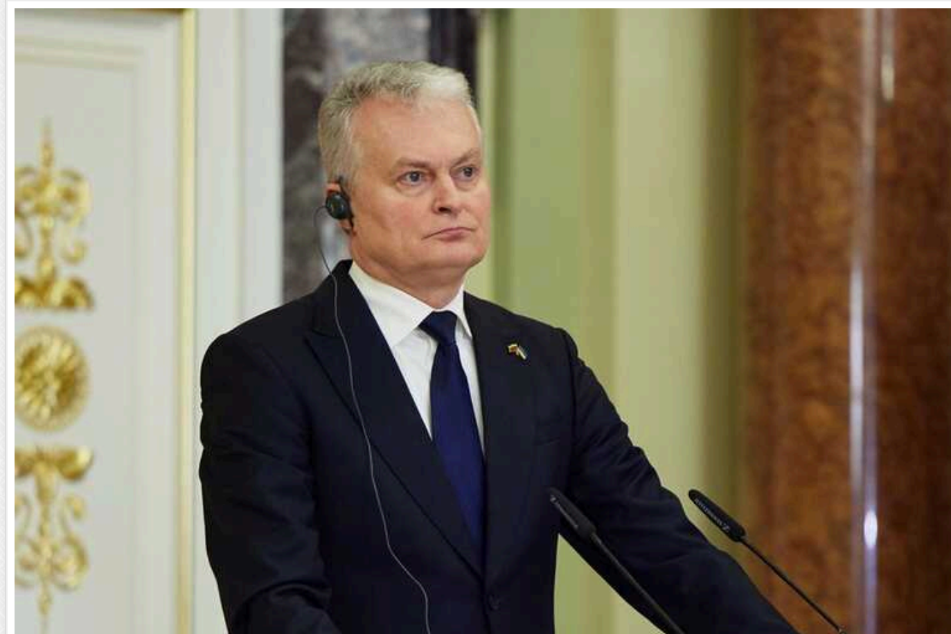
Науседа: Європа має відігравати більш активну роль у наданні озброєння Україні

В умовах, коли Україна досі не отримала обіцяної військової допомоги, Європейський Союз повинен зіграти активнішу роль у наданні допомоги Києву, в той час як у зарубіжних союзників не вистачає бажання.