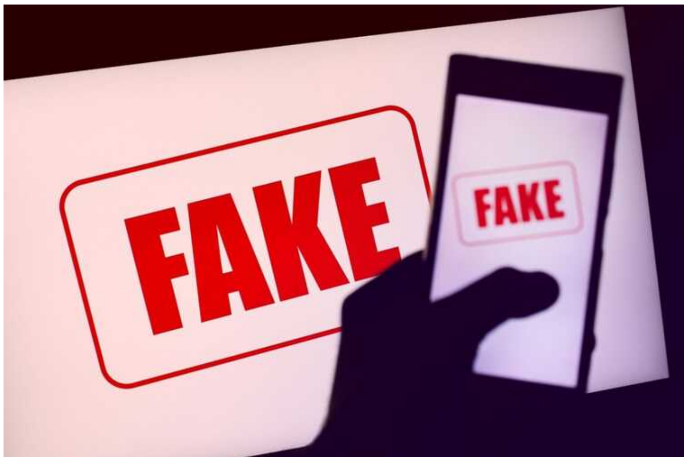
Мітинги в Україні: російська пропаганда поширює новий фейк