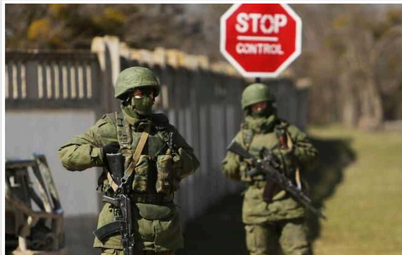
Агенти "АТЕШ" знайшли новий пункт перекидання військової техніки окупантів на фронт у Євпаторії

РФ почала задіювати залізничний вокзал в Євпаторії (Крим) для перекидання техніки на фронт.