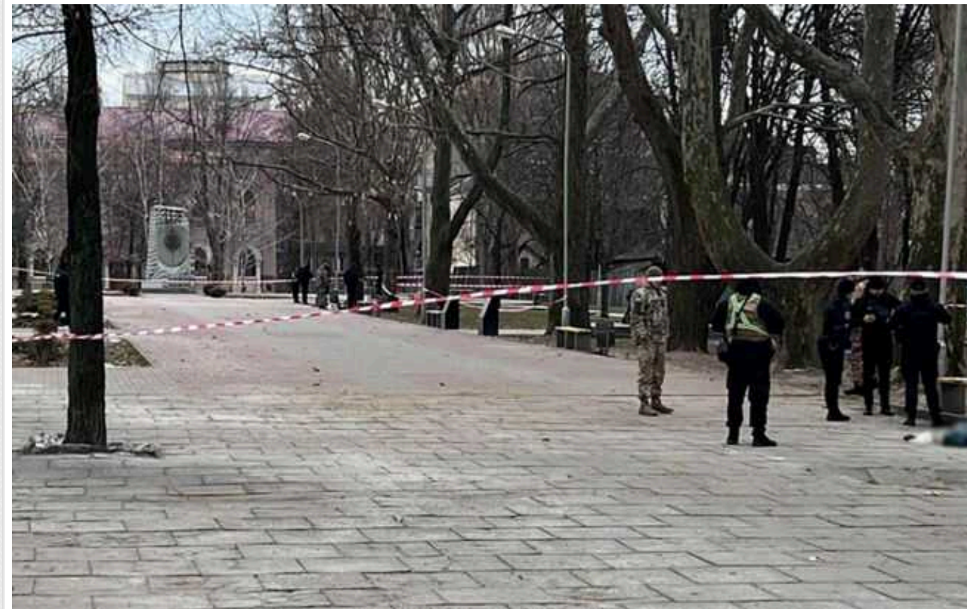
Стрільянина в центрі Запоріжжя: вбито жінку, кривдник вчинив самогубство

В центрі Запоріжжя сталася стрільянина 21 січня. Невідомий двома пострілами вбив жінку, а потім і сам вчинив самогубство.