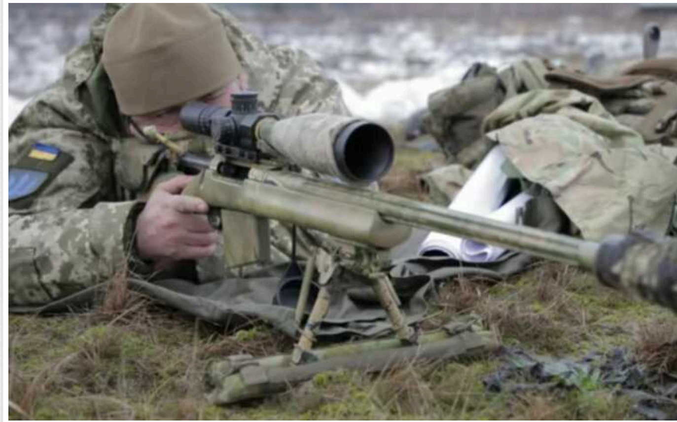
Окупанти стали активніше наступати, але зазнають великих втрат, – розвідка Британії

Розвідка Великої Британії зазначає, що російські окупаційні війська наростили наступальну активність по всьому фронту в Україні, через що збільшився рівень їхніх втрат.