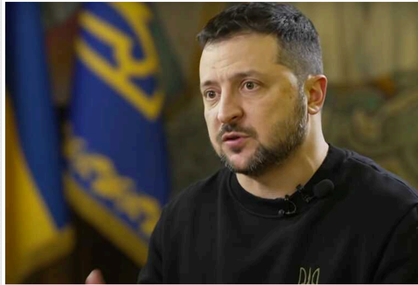
Зеленський розраховує на підтримку республіканців у Конгресі США щодо фінансування допомоги Україні

Президент України Володимир Зеленський заявив, що розраховує на республіканців у Конгресі США щодо ухвалення фінансування допомоги для нашої держави.